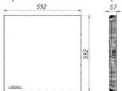
Рисунок 1 Светильник «L-office 32 Standart/Em», «L-office 55 Standart/Em»

1.7 Общий вид и габаритные размеры светильника показаны на рисунке 1.