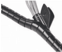
Рисунок 2 – Пример монтажа / Figure 2 – Mounting example